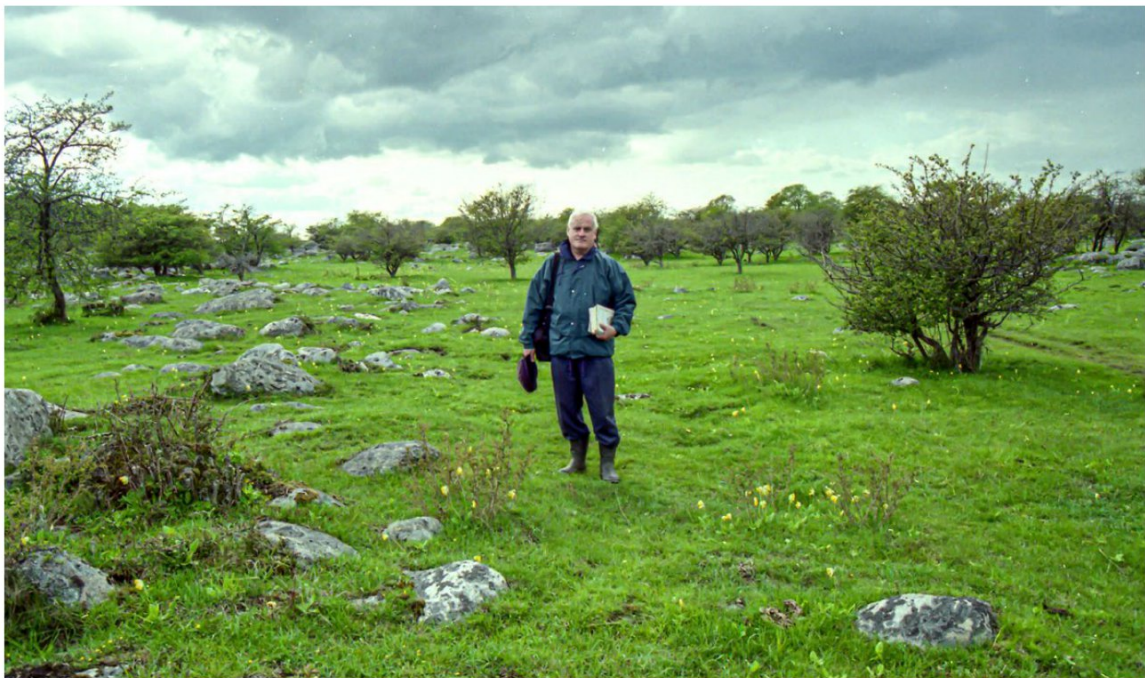
■ Kurt Nordman har fotograferat blomsterängarna i Tosteberga i Skåne.